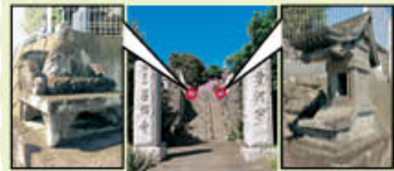
文殊菩薩 (学業の仏様) 門を上がるとあります 天沖様 (針供養)

奥様が書かれた「おもしろいお言葉」が本堂のお近くにある掲示板に随時飾られていますので是非みて下さい。