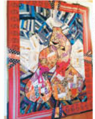
▲ひょうたんのキルト 作品名: 昔の思い出 (サンブラーキルト) お母様の形見の帯や着物、親しい友人と生地を交換しながらあるものを使い作っています。

甲斐犬のカイ君です。気は強いですが飼い主に従順です。お仕事帰りの旦那さんが、お散歩に連れて行ってくれるのを首をながくして待っています。