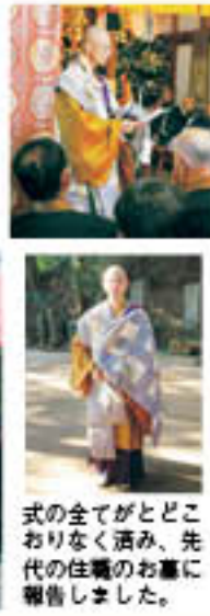
式の全てがとどこおりになく済み、先代の住職のお墓に報告しました。