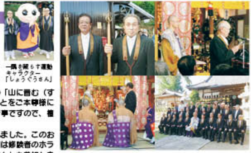
一隅を照らす運動キャラクター「しょうぐうさん」

またこの行事に先立ち、本堂までのお練り行列が行われました。このお練り行列は晋山式の始まりの目玉となります。お練り行列は修験者のホラ貝を先頭に一隅を照らす運動キャラクター「しょうぐうさん」も参加しました。