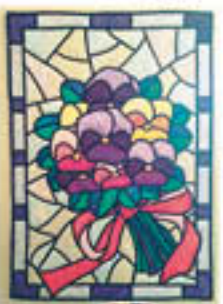
▲作品名: パンジー スタンドクッションや抱き枕などいろいろな作品。布の質感や色合いが気に入るところでも細かいステップが施されています。